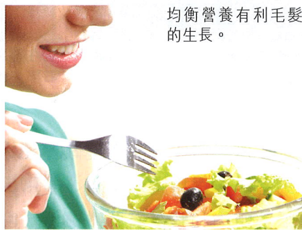
均衡營養有利毛髮的生長。